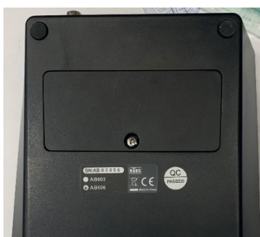
б) место нанесения и общий вид заводского номера