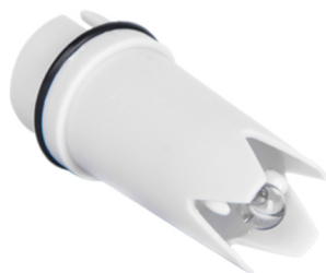
Рисунок 4 - Общий вид измерительных электродов (датчиков) рН-метра АВРОРА модификаций АВ 603