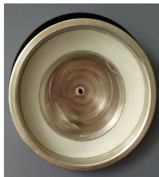
Вторичное окно с установленной защитной пленкой, подготовленное для установки кюветы