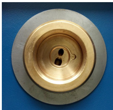
Вторичное окно для прохождения первичного и вторичного излучения